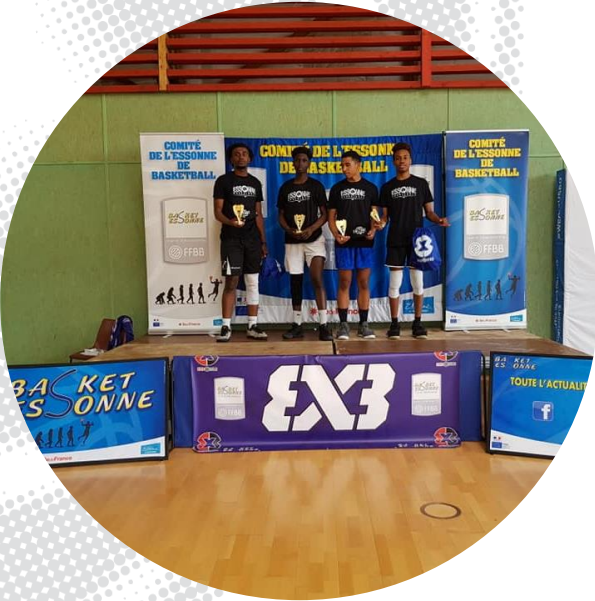
CHAMPIONS DEFENDERS 2019 l'équipe de COSAINV

Les 4 équipes ayant disputé les phases finales DEFENDERS