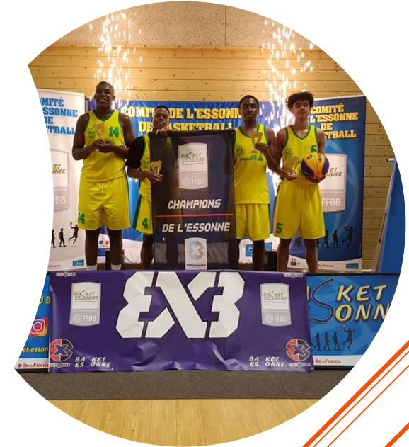
CHAMPIONS MASTERS 2019 l'équipe de Viry Chatillon